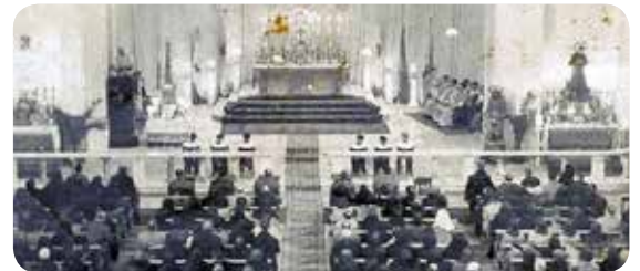
Inauguració del Santuari de Maria Auxiliadora