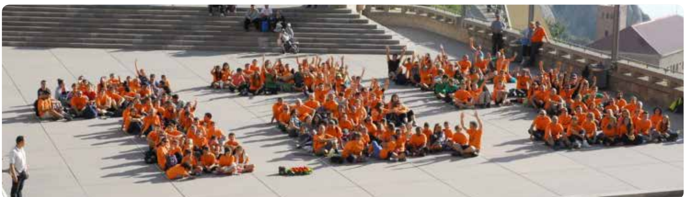
Mosaic dels 125 anys a Montserrat

Coincidint amb la celebració del 125è aniversari hem començat la implantació d'un projecte que hem titulat “ Connectats per aprendre (CXA) ” que vol vertebrar les accions a dur a terme per convertir l'escola en un centre educatiu del i per al segle XXI.