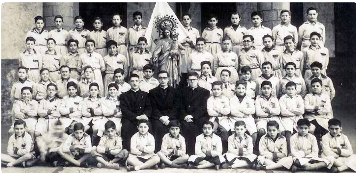
Foto de grup de la promoció 1952-53

Sota el lema “Un somni, una vida, un somriure” els Salesians de Rocafort, celebren el seu 125è aniversari (1890-2015). Un aniversari acompanyat pel reconeixement de l'ajuntament de Barcelona, que recentment els ha concedit la "Medalla d'Honor de la ciutat" per la seva contribució a la formació de les persones i en favor de la seva dedicació als més necessitats”. Així doncs, la comunitat educativa-pastoral de Rocafort està de festa i des d'octubre de l'any passat realitza diferents actes, activitats i celebracions en el marc d'aquest aniversari tan especial i emotiu, que ha coincidit també amb el bicentenari del naixement de Sant Joan Bosco.