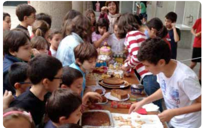
Esmorzar solidari per a projectes de cooperació al desenvolupament