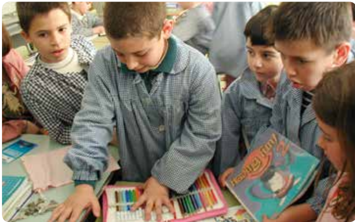
Alumnes treballant a classe